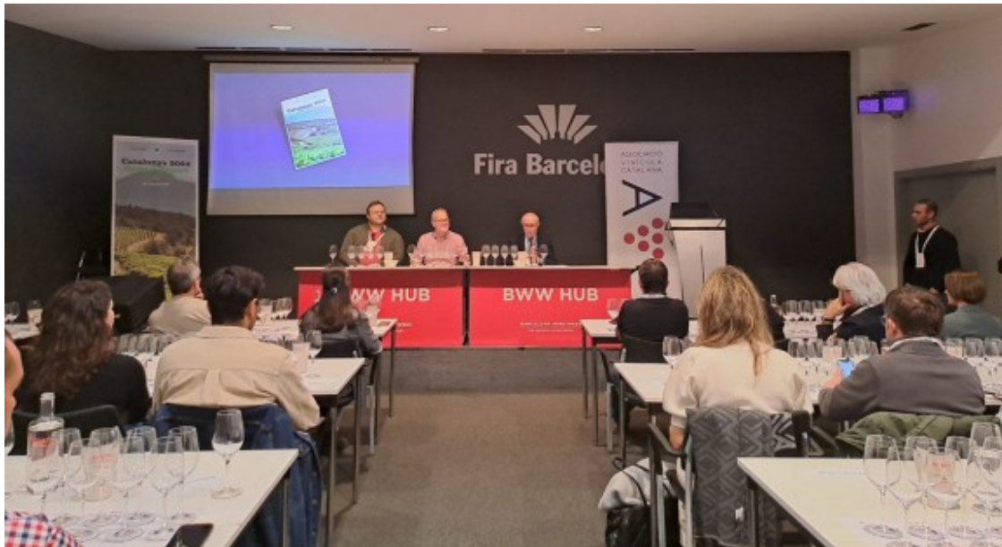
Presentació de l'Informe Tim Atkin MW a la Barcelona Wine Week

Catalan Wines Special Report de Tim Atkin MW entrega 12 certificats d'excel·lència a representants del sector vitivinícola català. Dels 1046 vins tastats, 630 superen els 90 punts